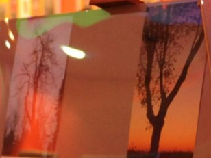
Pa. Włocławek Szkoła nr 1