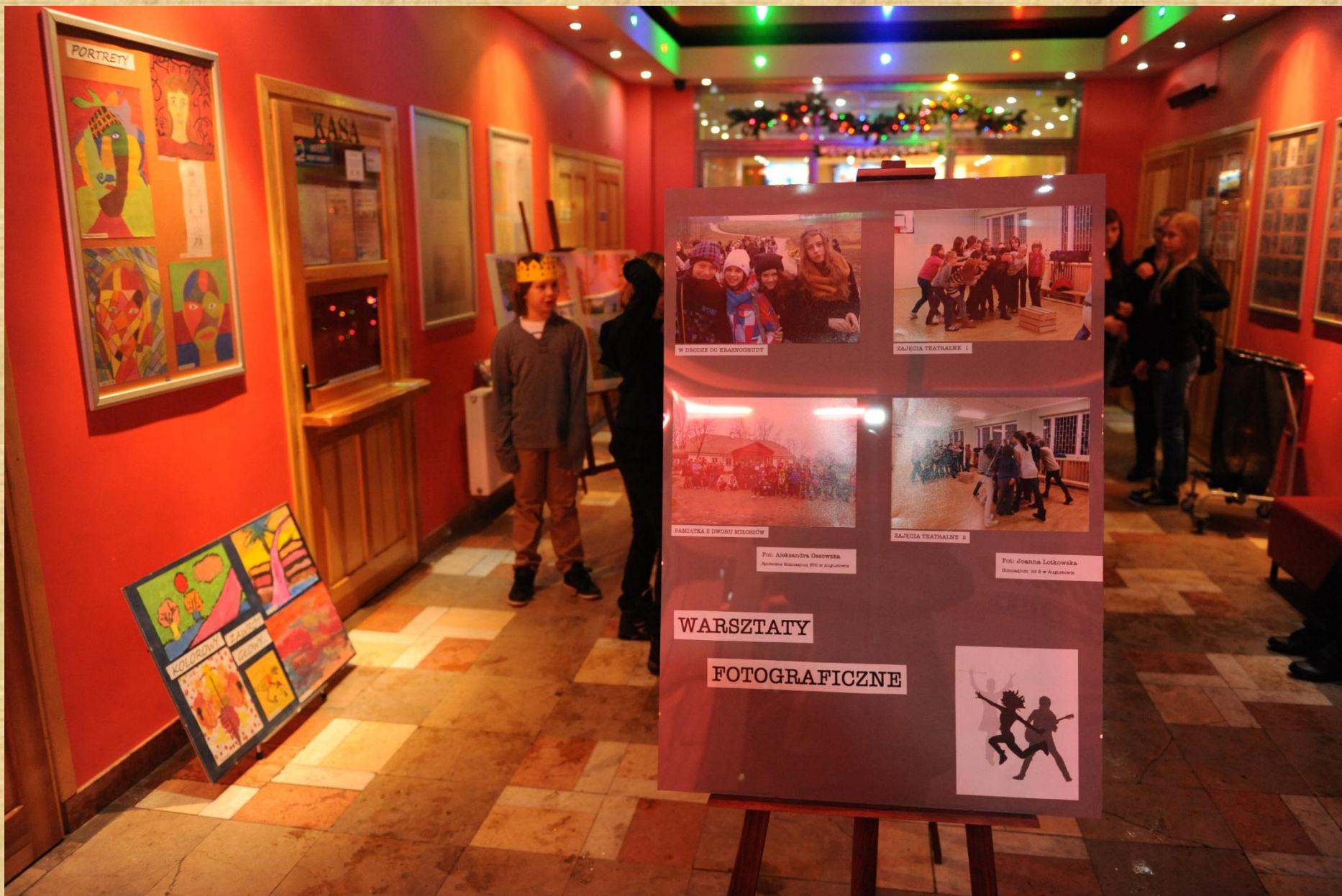
Wystawa prac plastycznych i fotografii uczestników naszego projektu.