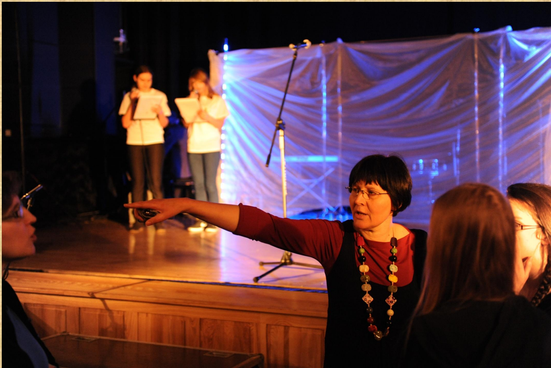
Nerwowe przygotowania przed premierą projektowego spektaklu.